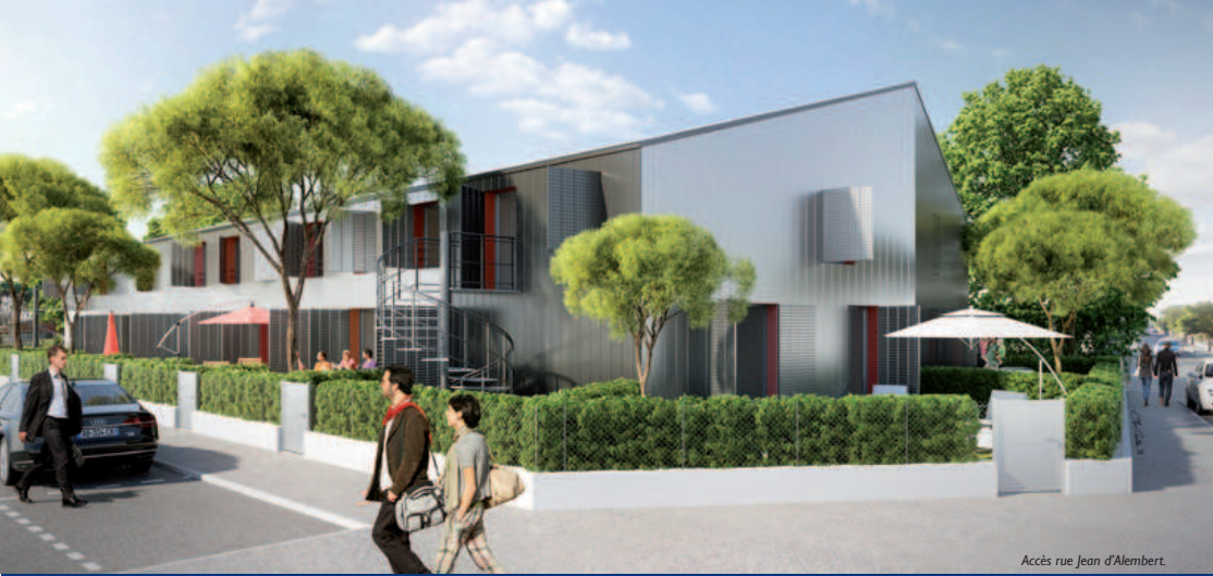
Accès rue Jean d'Alembert.