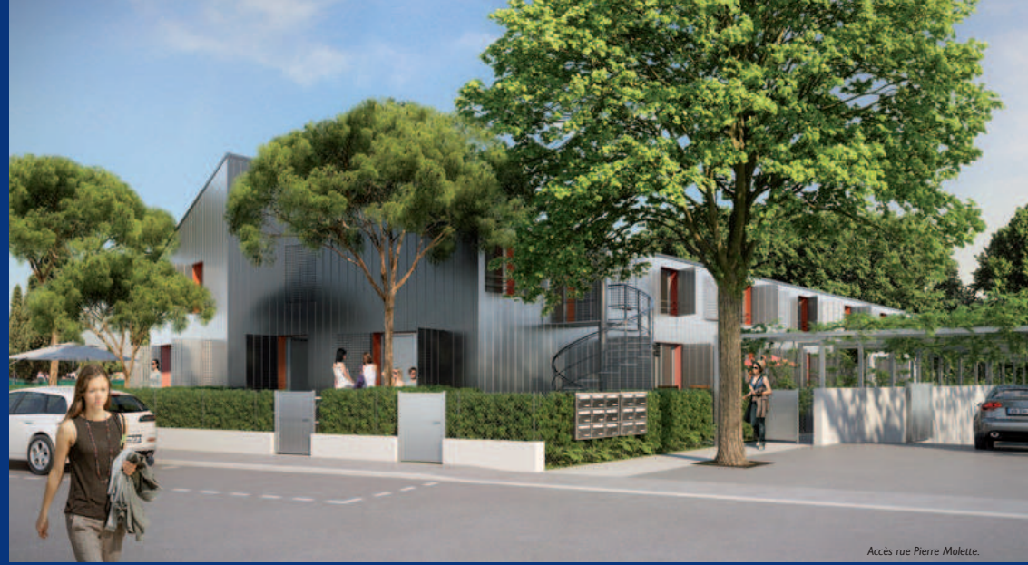
Accès rue Pierre Molette.

© 2012 Les Imprimés - Mars 05 01 91 15 48 | 06 03 137 | Photos non contractuelles.